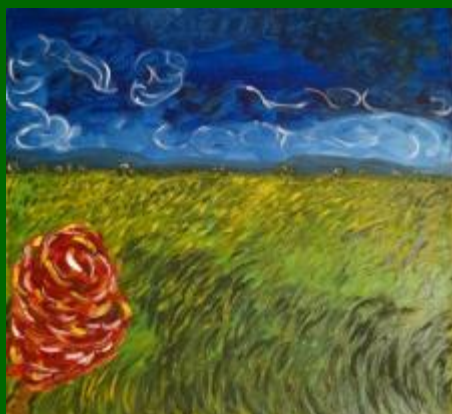
Nº 02 Campos de Castilla 63*67 - 160€