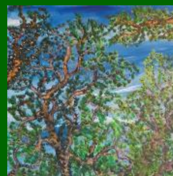
Nº 22 Cielo y copas 50*50 - 110€

F. Gochi , tiene un estilo influido por el expresionismo y el fovismo del XIX. La técnica empleada es óleo sobre lienzo. La exposición está basada en dos temas: “campos de Castilla” y “cielo y copas” Por diferentes motivos ha residido en Salamanca, Zaragoza, Santander, Bilbao, Barcelona y en Oviedo en la actualidad.