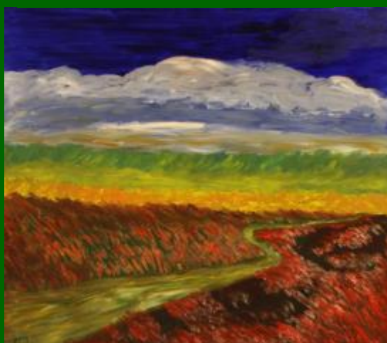
Nº 11 Campos de Castilla 71*81 -180€