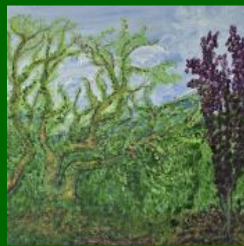
Nº 21 Cielo y copas 50*50 - 110€