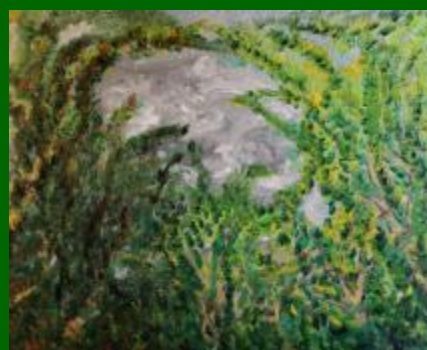
Nº 12 Cielo y copas 50*61 - 130€