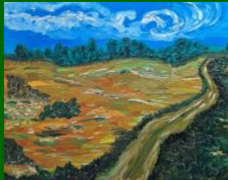
Nº 08 Campos de Castilla 50*65 - 120€