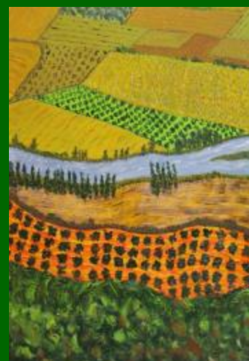
Nº 05 Campos de Castilla 73*50 - 140€