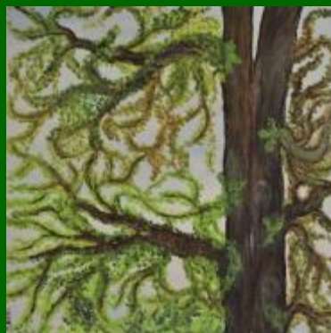
Nº 19 Cielo y copas 50*50 - 110€