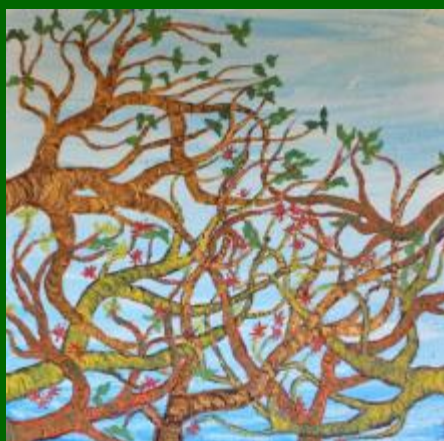
Nº 14 Cielo y copas 60*60 130€