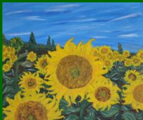
Nº 10 Campos de Castilla 55*65 cm