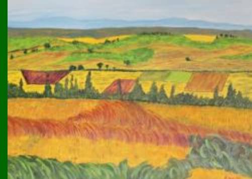
Nº 09 Campos de Castilla 50*70 130€