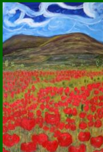
Nº 04 Campos de Castilla 73*50 - 140€