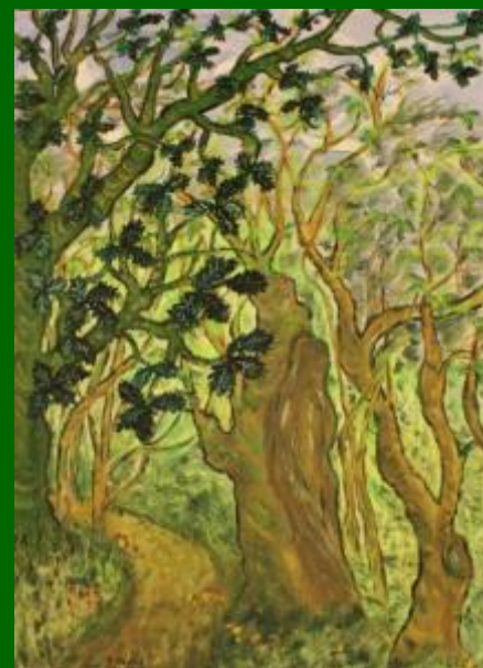
Nº 17 Cielo y copas 80*60 - 180€