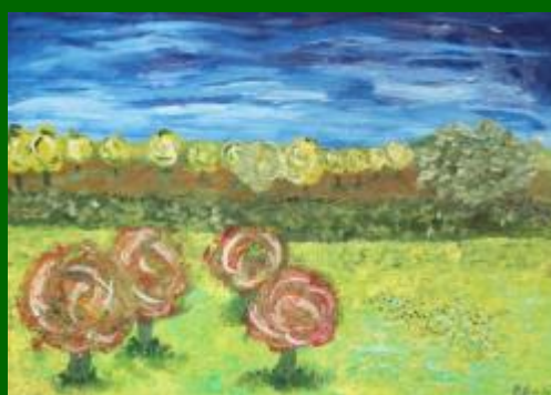
Nº 06 Campos de Castilla 50*70 -130€