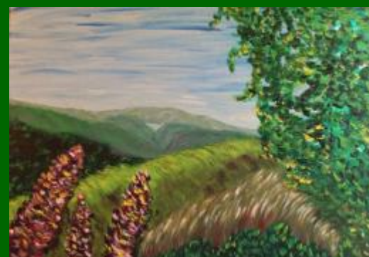
Nº 13 Cielo y copas 50*70 130€