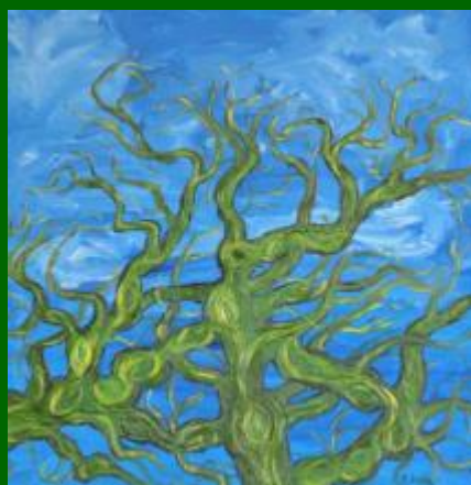
Nº 15 Cielo y copas 60*60 - 130€