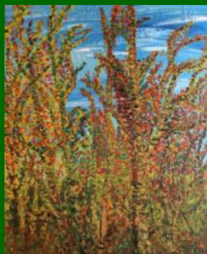
Nº 16 Cielo y copas 61*50 - 120€