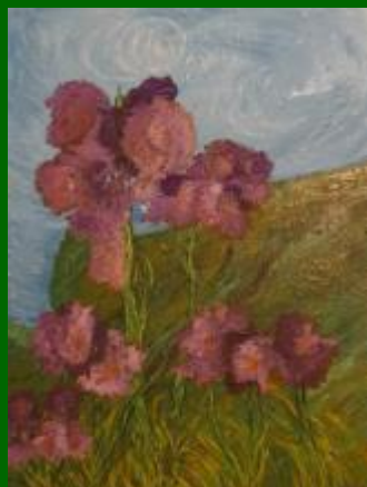
Nº 18 Cielo y copas 60*46 - 110€