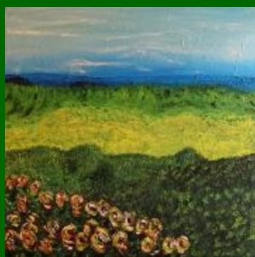
Nº 01 Campos de Castilla 50*50 -110€

Del jueves 29 de febrero al domingo 31 de marzo 2024