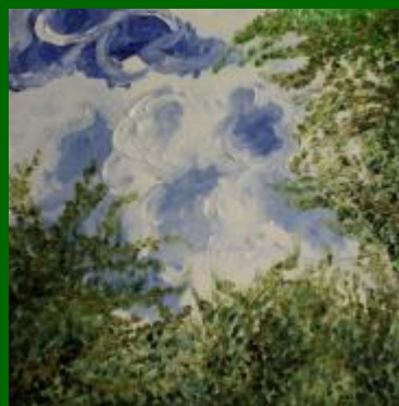
Nº 20 Cielo y copas 50*50 - 110€